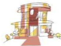
IES EDUARDO LINARES